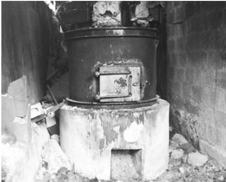
ഓറിയോൺ കെമിക്കൽസിലെ ബോയിലർ കത്തിനശിച്ച നിലയിൽ

* ഓറിയോൺ കമ്പനിയിലെ തീപിടുത്തവുമായി ബന്ധപ്പെട്ട് ഉന്ന