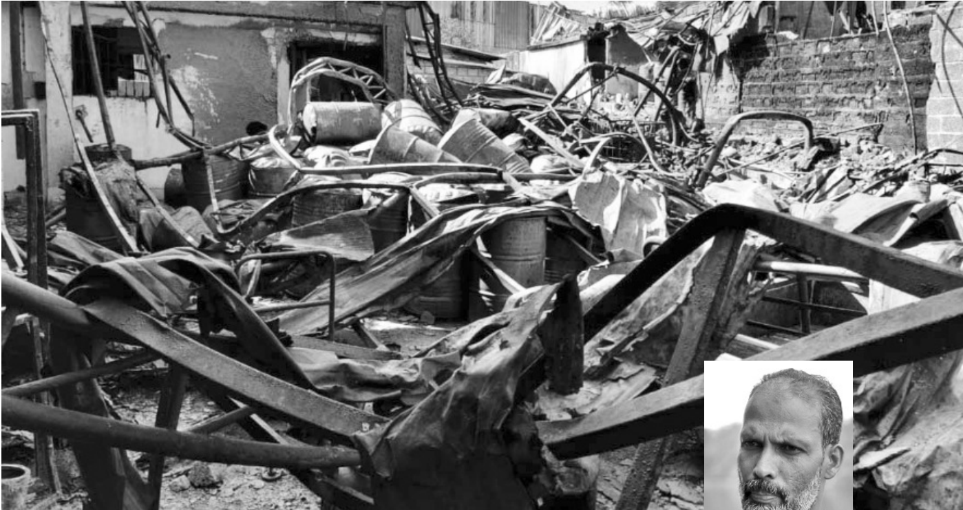
അഗ്നിബാധയിൽ ചാമ്പലായ ഓറിയോൺ കമ്പനി